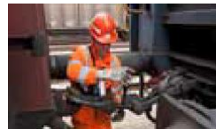
Dezentraler Service (standortungebundene präventive und korrektive Maßnahmen)