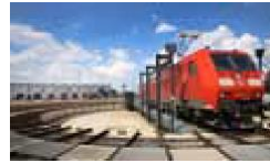
Schwere Instandhaltung inklusive Komponentenaufarbeitung