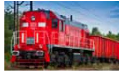
Organisation der Instandhaltung im laufenden Betrieb (stationäre präventive und korrektive Maßnahmen)